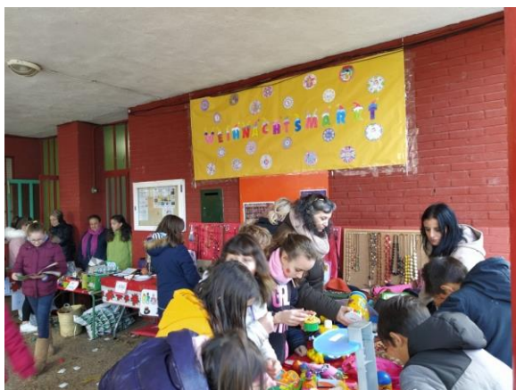
• Actividades Extraescolares.

Las familias preparan, participan, coordinan y colaboran con el profesorado y alumnado a lo largo del curso aportando su esfuerzo y dedicación en variadas propuestas y actividades.